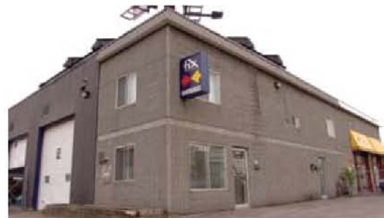
Fix Auto Montréal Ouest 6010, Saint-Jacques Ouest – Montréal

Au quotidien, cette approche se traduit par un roulement suivant lequel tout cas de courte durée est aussitôt pris en charge, et qu'aucun véhicule n'est en attente durant plus de 4 heures.