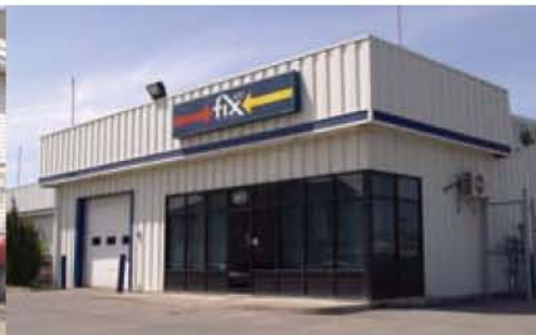
Fix Auto Vaudreuil 610, Chicoine – Vaudreuil