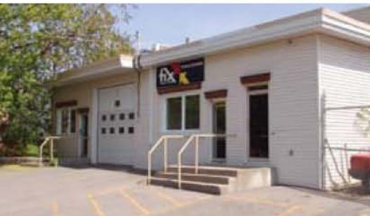
Fix Auto Pierrefonds 5, Paiement – Pierrefonds

À Pierrefonds, siège des trois ateliers, les effectifs sont de 10, et la superficie, de 6100 pi 2 ; une équipe de 12 dispose à Montréal-Ouest de 9000 pi 2 , tandis qu'à Vaudreuil un groupe de 10 a une aire de 8500 pi 2 .